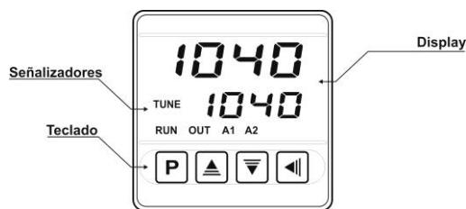
Fig. 02 - Identificación de las partes del panel frontal

El panel frontal del controlador, con sus partes, puede ser visto en la Fig. 02 :